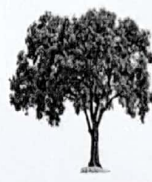
Bol pang / bite