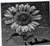
Bibal / bite